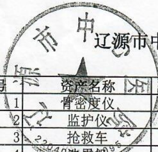
辽源市中心医院固定资产报废明细表